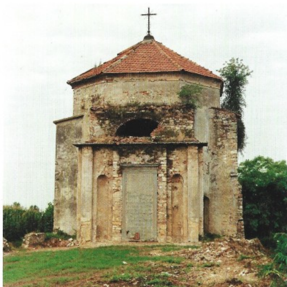
Figura 7: San Rocco prima della ristrutturazione