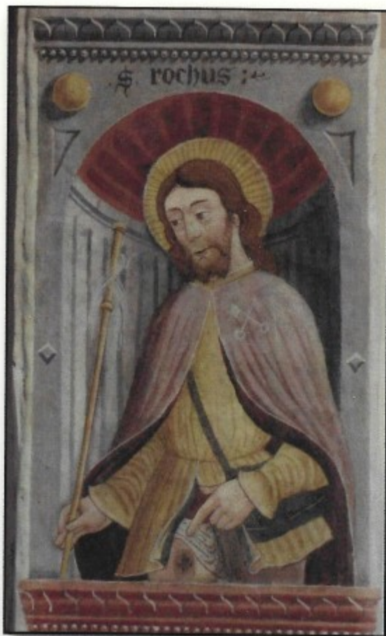
Figura 3: L'affresco di San Rocco in chiesa vecchia di Maffiolo da Cazzano 1477

Il vescovo decreta " La capella di S. Rocho si seri con la sua bella feriata quanto più tosto con le elemosine che si raccolgono ". E' da ricordare che il vescovo Ragazzoni (1577-1592) amico di Carlo Borromeo, ebbe il merito di "... eccitar in patria la devotione di S. Rocco in preservatione del contagio ". (cit. Donato Calvi: "Effemeridi" - I pag. 180)