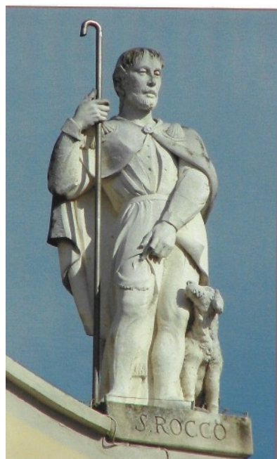
Figura 9: la statua di San Rocco nella facciata della parrocchiale opera di Elia Aiolfi 1990