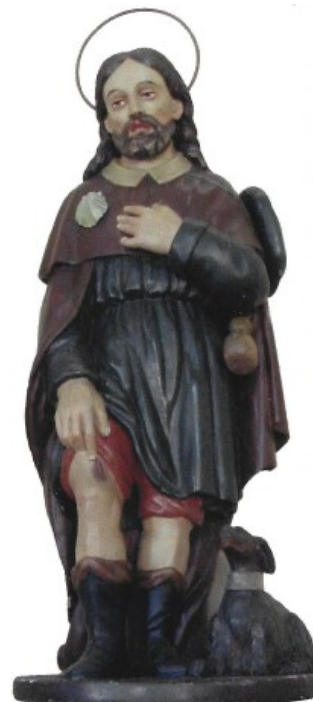
Figura 4: la statua in legno di San Rochino di autore ignoto