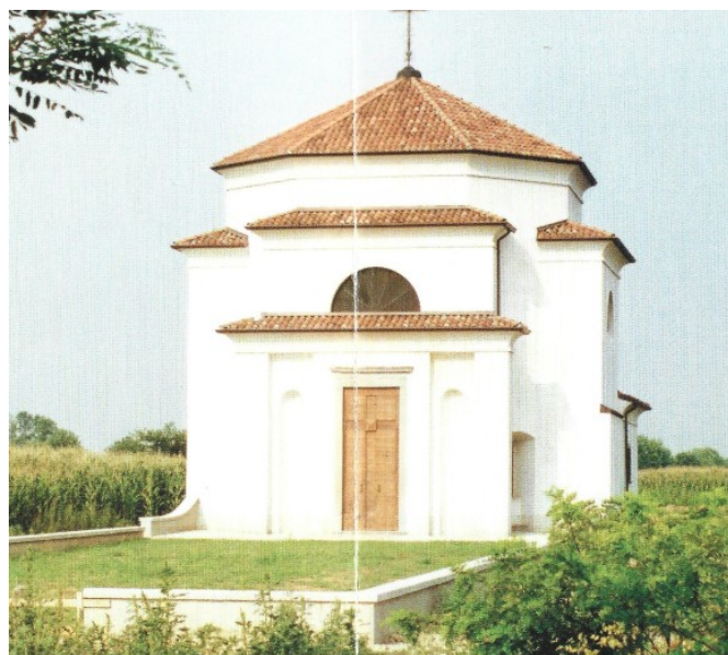
Figura 8: San Rocco dopo la ristrutturazione del 1990

In sintesi le tappe della ricostruzione: