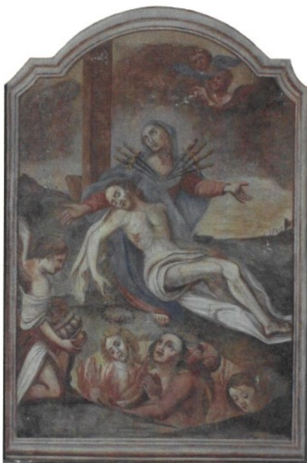
Figura 2: L'affresco sull'altare di autore ignoto del 700.

San Rocco - XIV secolo - pellegrino - canonizzato nel 1629 — festa il 16 agosto