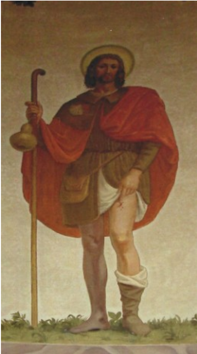
Figura 1: l'affresco di S. Rocco sulla facciata del presbiterio della parrocchiale opera del pittore Elio Coccoli da Brescia 1942