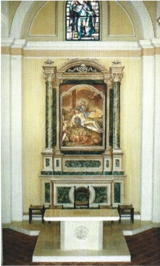
Figura 5: il presbiterio e l'altare principale nella chiesa di San Rocco

La chiesa di S. Rocco ai Mortivecchi di Mornico sorge a nord del paese a circa un chilometro di